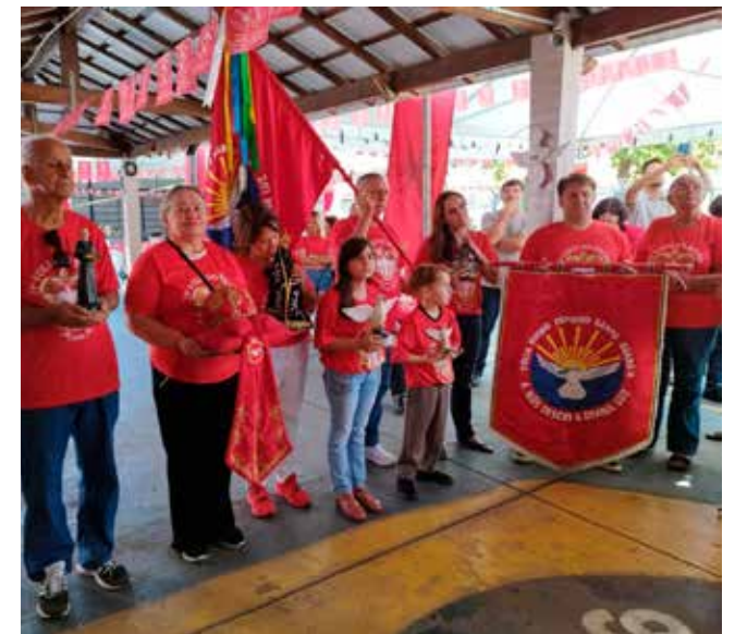
O senador Izalci Lucas e família completaram 10 anos de Folia do Divino

Em 2027, a Folia do Divino, da Paróquia Divino Espírito Santo, vai comemorar 30 anos e toda programação já está praticamente fechada. Faltam poucos detalhes!