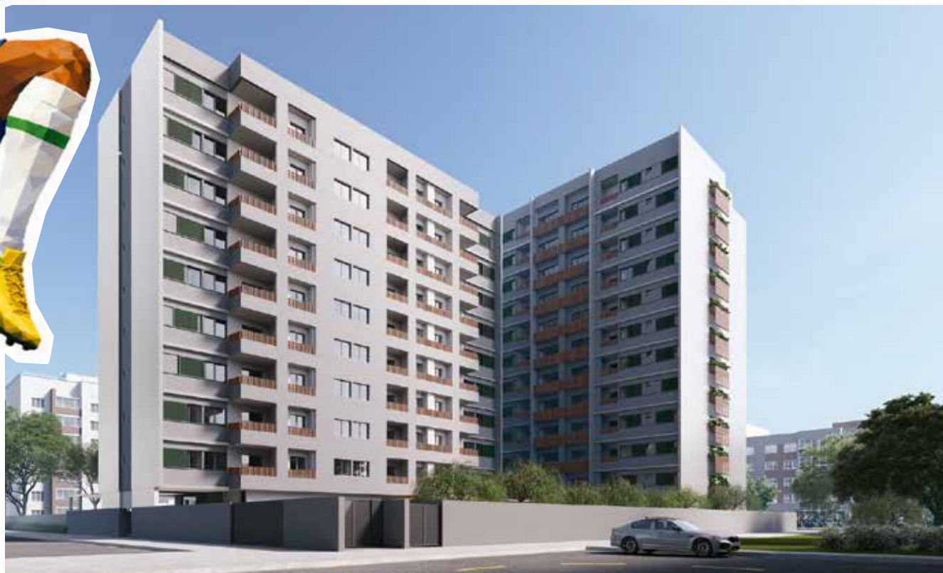
4º Ofício do Guarã R-5 /51.366